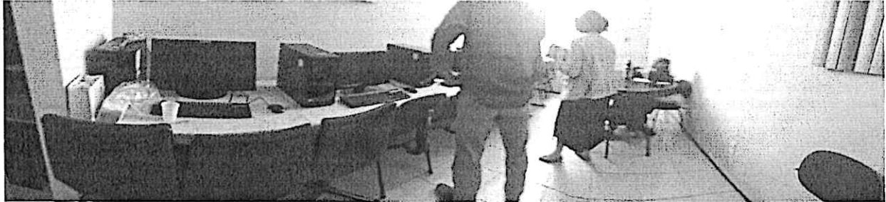
Sala de aula