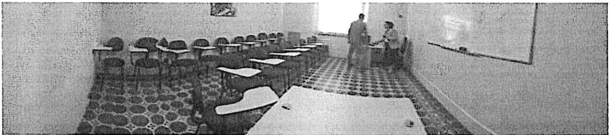
Foto da reunião