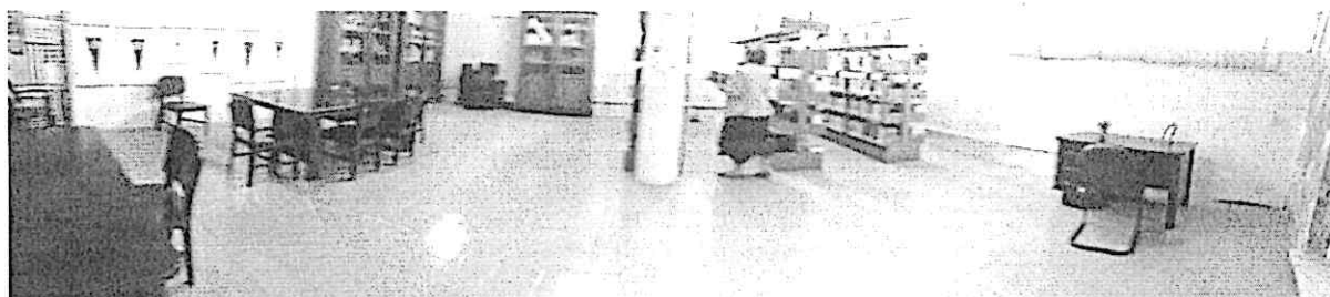
Ex sala dos professores